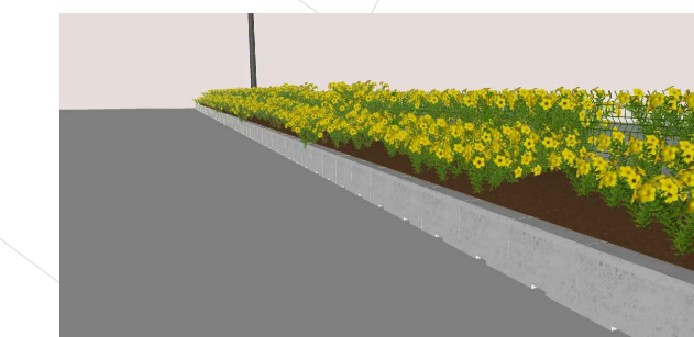
DETALHES DO CANTEIRO CENTRAL