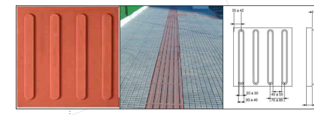
DETALHE PISO TÁTIL SEM ESCALA